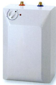
5 Liter Unter Tisch