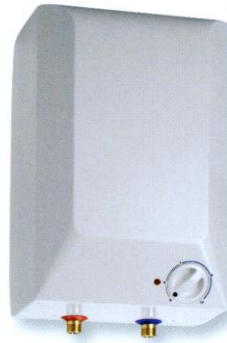
5 Liter Ober Tisch